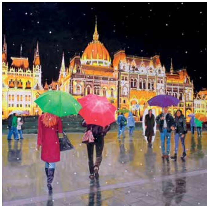
Giovanni Pulze "Budapest Angel" 2022, acrilico su tela, cm 80 x 80.

Il lavoro pittorico di Giovanni Pulze ha incorporato ormai da molti anni la figura dell'Angelo. Sullo sfondo una metropoli sul modello del non-luogo o, in altri casi, una città dai profili riconoscibili (New York, Trieste, Salzburg, San Francisco, Torino, e così via), per lo più immersa nel nevischio e con un turbinare di persone e mezzi di trasporto ad aumentare il caos. Ma la presenza dell'Angelo non è avvertita; il suo messaggio non è percepito: le persone rimangono chiuse nel loro mondo autistico e nei loro affari.