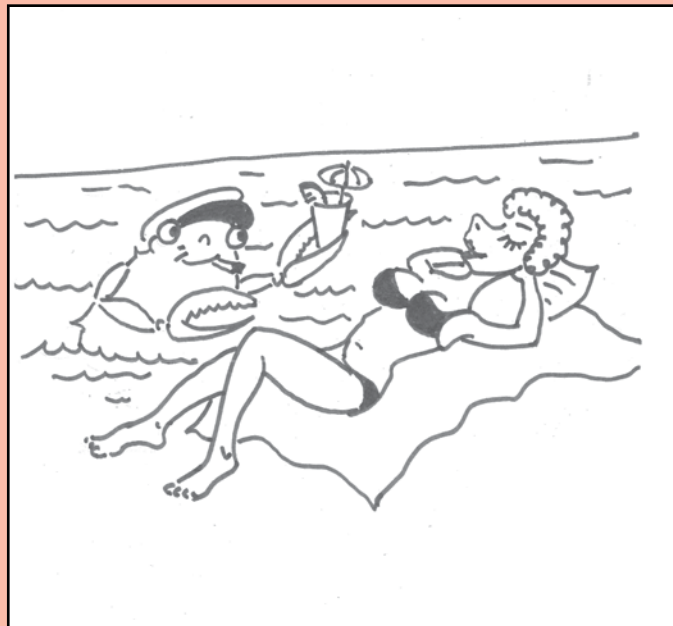
Illustrazione di Antonio Sofianopulo

Liang Ha "Elasticity" 2025, oil on linen mounted on wood panel, 40 × 30 cm, dettaglio.